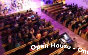
Open House - One thing remains