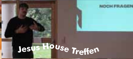
Jesus House Treffen