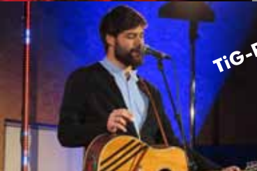
TIG-Point 10 Jahre