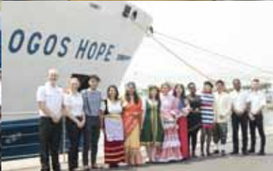
Friederikes Missionseinsatz mit OM