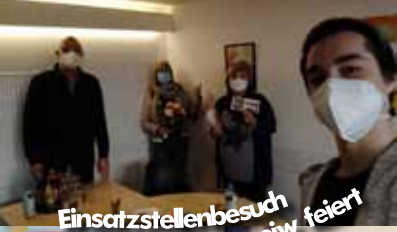
Einsatzstellenbesuch ejw feiert