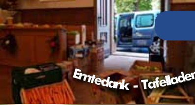
Erntedank - Tafelladen