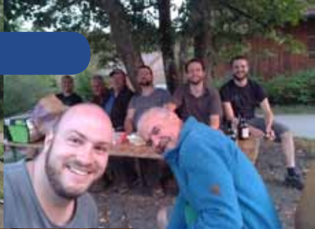
Auf- und Abbaulager